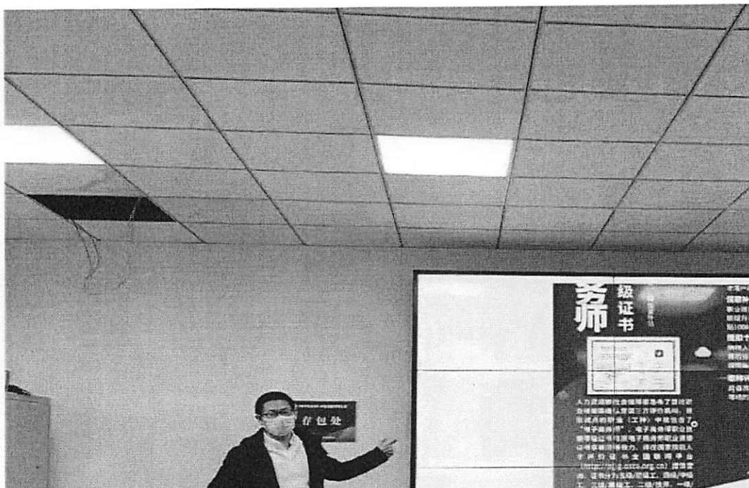
图 1 电子商务师取证