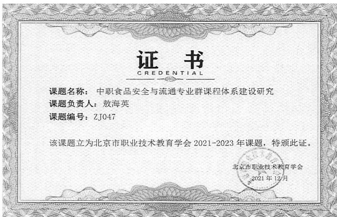
图 2 课题立项证书